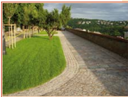
A sétány felújítás előtt és után