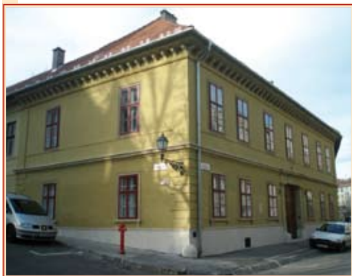
A felújított Donáti utca 32.

nem térítendő támogatást elnyerni. Az önkormányzat megkönnyíti a társasházak hitelfelvételét is a hitelösszeg 20%-áig terjedő óvadék biztosításával. 2005-ben öt, 2006-ban már tizenhárom társasház kapott kamatmentes támogatást gázvezeték felújításához. A következő években ez a tendencia várhatóan folytatódni fog.