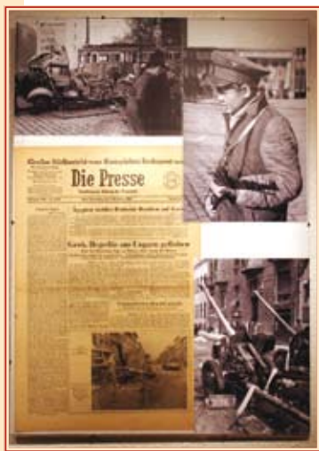
A kiállítás darabja