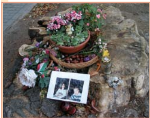
A Bem rakparti tragédia emlékhelye

A ugusztus 20-án ete százezrek gyűltek össze a Duna-parton a tűzijáték megtekintésére. A rendezők azonban nem készültek fel a