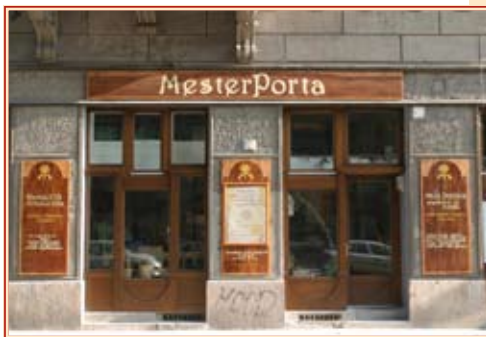
A Corvin téri bejárat

Január 19-én a Corvin téren megnyílt a Hagyományok Háza Mesterportája, ahol a magyar népművészet autentikus tárgyai kerülnek bemutatásra és a kézműves portékák meg is vásárolhatók. Ezen felül a Mesterporta ellátja egy népművészeti információközpont szerepét, és feladatai közé tartozik a népművészeti mozgalom ápolása, rendezvények szervezése is.