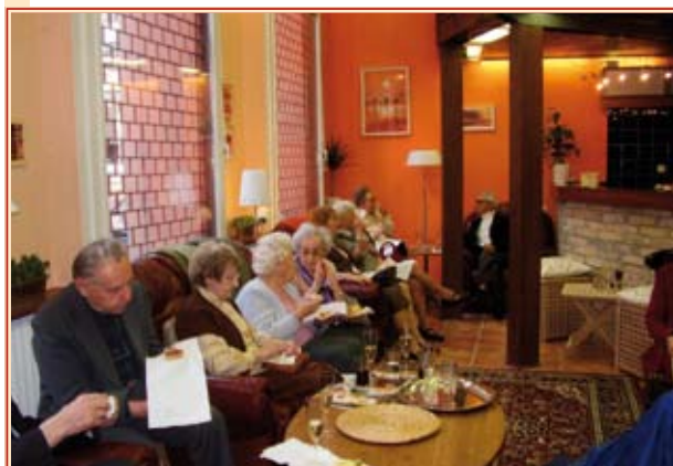
Az Idősek Klubjának megnyitója

Új Idősek Klubja nyílt a Vízivárosban, a Fő utca és a Szilágyi Dezső tér sarkán, amelyet az önkormányzat mintegy húszmillió forintos