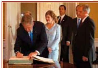
George W. Bush látogatása a köztársasági elnöknél

J únius 21–22 között hazánkba látogatott az Amerikai Egyesült Államok elnöke, George W. Bush. Amerikai elnöki látogatásra legutóbb 1989-ben került sor, amikor a most hivatalban lévő elnök édesapja köszöntötte a szabadságot választó közép-európai országokat. Az amerikai elnök hivatalos programjában a miniszterelnökkel és más állami méltóságokkal találkozott. Sólyom László köztársasági elnök a Sándor Palotában fogadta az illusztris vendéget, aki bejegyezte nevét az önkormányzat által adományozott díszes könyvbe. Bush elnök Citadellánál elmondott beszédét a világ számos tévésatornája közvetítette, háttérben a Budai Vár látképével.