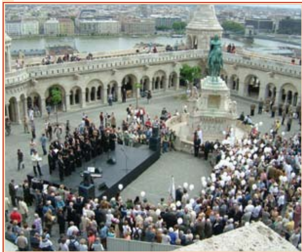
Fent: ünnepi műsor a Szent István szobornál Lent: részlet a szobor talapzatán található domborműből