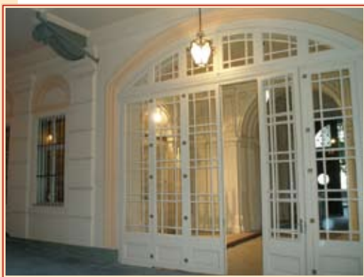
A művelődési ház felújított kapualja

Negyven éve működik a kerületi Művelődési Ház, a legendás „Bem rkp. 6.” Az évfordulóra felújították a kapualjat és az udvart, új burkolatot kaptak a közösségi terek. Az elmúlt évtizedek alatt olyan