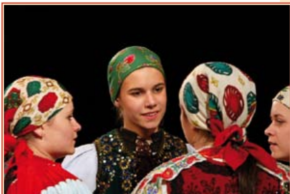
Pillanatkép a jubileumi műsorból

M árcius 11-én a Barabás villában ünnepelte fennállásának 125. évfordulóját a Szilágyi Erzsébet Gimnázium. Az évfordulás ünnepségek június 10-én koncerttel, majd szeptember 9-én faklyás felvonulással folytatódtak, amely a gimnázium egykori helyé-