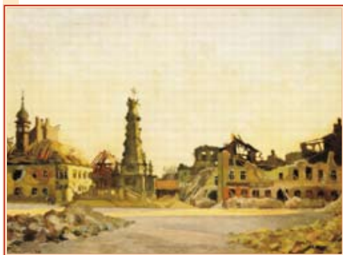
A Szentháromság tér az ostrom után