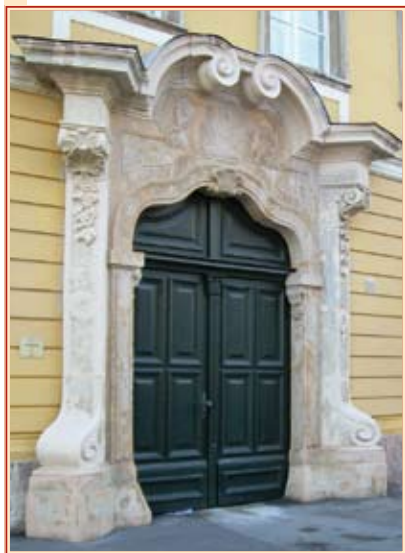
Az Úri utca 50. számú ház felújított bejárata

Ősszel látványos eredményeket hozott a vári önkormányzati épületek felújításának első szakasza. Az önkormányzat mintegy 80 millió forintból 55 vári ingatlanon végzett homlokzati javítást, állagmegóvást; több helyen a régi kapukat is felújították. Számos házon új lábazatokat helyeztek el, és pótolták a hiányzó rácsokat is. A munkák elvégzését műemlékvédő-restaurátor szakemberek felügyelték. A mostani felújításokat az tette lehetővé, hogy a Kulturális Örökségvédelmi Hivatal – megértve az igényeket – újraértékelte korábbi álláspontját és hozzájárult az egyes épületek részleges felújításához.