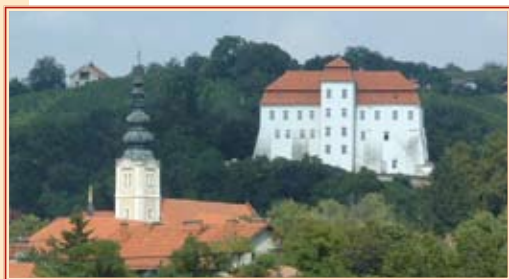
A lendvai vár

T estvérvárosi szerződést kötött május 26-án a Budavári Önkormányzat és a muravidéki Lendva önkormányzata. Az eseményre a Kézfogás Egyesület és a Budavári Lakosok Szövetségének tagjai is elutaztak. Jelenlétükben zajlott az ünnepélyes aláírási ceremónia a lendvai vár dísztermében. Az aláírást követően a Tabulatura Együttes adott koncertet, majd a helyi Borfesztivál záró, díjátadó ünnepségére került sor.