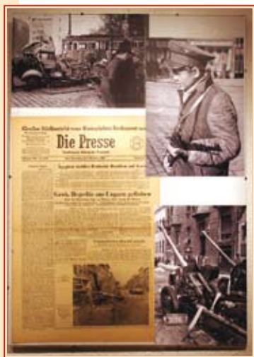
A kiállítás darabja