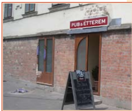
Az Aranyszarvas ház megtisztítása

jelentkezettek a februárban meghirdetett, új pályázatra. Tavaly 14 lakóház kapott ilyen támogatást; az önkormányzat több mint 550 négyzetméternyi felületről tüntette el a falfirkát, és 1200 négyzetméteren helyezte el az antigraffiti-bevonatot. Újratisztították az ismételten befűjt falakat is.