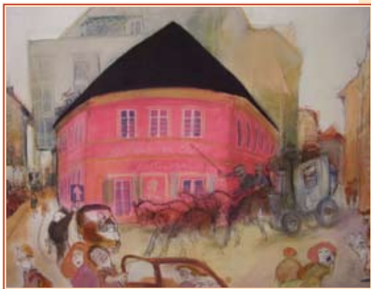
Sajdik Ferenc Vasalóház című képe

J únius 28-án a Várnegyed Galéria Sajdik Ferenc munkáiból rendezett kiállítást. Sajdik karikatúráit, Csukás István meséihez készített rajzait, Pom-Pom meséit kicsik és nagyok egyaránt ismerik; a gyermekirodalom és a gyermekfilm-kultúra klasszikus részeivé váltak. Kevesen tudják azonban, hogy a művész számos, a kerület valamely részét és jellegzetes alakjait is megörökítette rajzain, festményein. A kiállításon a magyar történelem nagyjait felsorakoztató „Magyar Nemzeti Múzeum” című kép mellett ezek is szerepeltek.