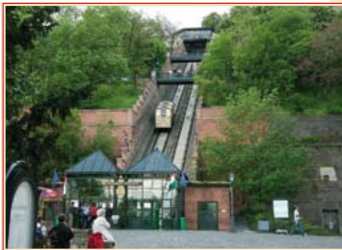
A Budavári Sikló

20 éve, 1986-ban avatták fel ismét az 1870-ben épített Budavári Siklót. Az eredeti, 1944-ig közlekedő siklót ugyanis csak negyven év szünet után indították újra. Az évforduló alkalmából egy kis kiállításon mutatták be a történelmi előzményeket. Meglepő, de a statisztikák szerint évente egymillió utasa van.