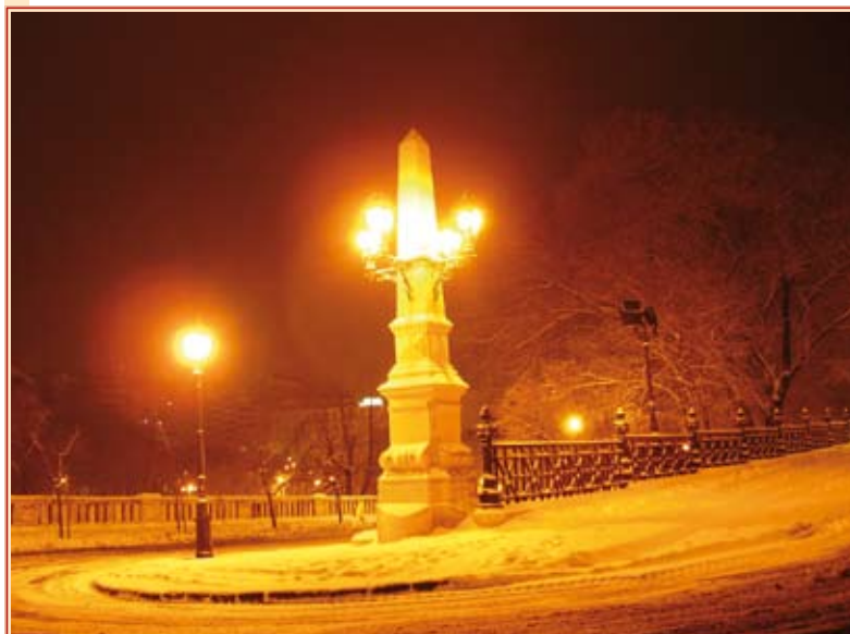
A felújított obeliszk a Palota úton

R égi helyére került, a Palota útra, a Kemál Attatürk sétány elágazásához az az obeliszk, amely még a II. világháború pusztításának esett áldozatul. A díszes lámpatartót az önkormányzat rekonstruálta. A hajdani korlát helyreállítását követően ezzel folytatódott a királyi palota környezetének visszaállítása. Az önkormányzat a többi hiányzó obeliszk felállítását is tervezi.