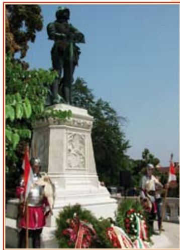
Díszörség Hunyadi János szobránál