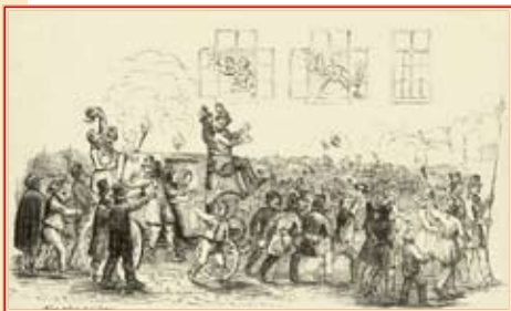
Táncsics Mihály kiszabadítása budavári börtönéből

A március 15-i megemlékezések keretében Bökönyi Laura és Csobolya József verssel és dallal idézte fel a tavaszi forradalom em-