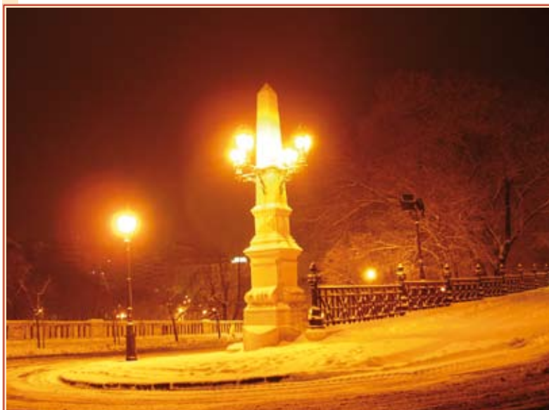
A felújított obeliszk a Palota úton

R égi helyére került, a Palota útra, a Kemál Attatürk sétány elágazásához az az obeliszk, amely még a II. világháború pusztításának esett áldozatul. A díszes lámpatartót az önkormányzat rekonstruálta. A hajdani korlát helyreállítását követően ezzel folytatódott a királyi palota környezetének visszaállítása. Az önkormányzat a többi hiányzó obeliszk felállítását is tervezi.