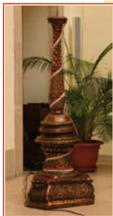
A rekonstruált gyertyatartó

A z ünnepségek harmadik napján – éppen úgy, ahogyan 320 évvel korábban – hálaadó Te Deum-ot tartottak a Mátyás templomban. Ekkor került itt elhelyezésre annak a reneszánsz gyertyatartónak két másolata, amelyet a törökök Isztambulba szállítottak és ami ma is látható az Aya Sofia templomban. A másolat elkészítése hosszú szakmai együttműködés eredményeként és a Márai Sándor Kulturális Közhasznú Közalapítvány anyagi támogatásával valósulhatott meg.