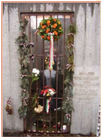
Az emlékmű a Tabánban

Február 25-én a Kommunizmus Áldozatainak Emléknapján megemlékezést tartottak a politikai okokból bebörtönözöttek tabáni emlékművénél. A börtöncellában ülő alakot évekkel ezelőtt magánkezdeményezésre állították fel Makovecz Imre tervei alapján. A megemlékezésen részt vettek a recski kényszermunka-táborok foglyainak képviselői és a politikai okokból bebörtönözöttek, kitelepítettek szervezetei is.